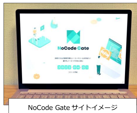
NoCode Gate サイトイメージ