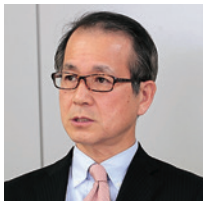
株式会社J-オイルミルズ シニア・エグゼクティブ・マネージャー 情報システム部長

また、ASTERIA Warpの場合、新たにExcel形式のファイルがそのまま簡単に扱えるようになる点も魅力だったという。