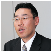
株式会社J-オイルミルズ 情報システム部 課長