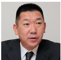
一般財団法人東京保健会 病体生理研究所 事務長

2つ目が、連携先の追加が容易なシステムであることだ。「改修の手間やコストができるだけ抑えられる、柔軟性の高い仕組みを求め