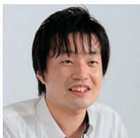
株式会社ダーツライブ 情報システム課