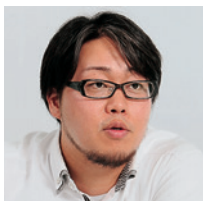
株式会社ダーツライブ 情報システム課

「組織の再編があると、当然、社員の所属部門などが変更になります。したがって、それを各種システムに反映しなければなりません。例えばActive Directoryに登録してある所属や職位などの情報や、メールグループの設定、社内ポータルの設定などです。このシステム変更にかかる時間が長くと、それだけプロジェクトの立ち上げも遅れることになりま。そのため、変更はできる限り速やかに、かつ誤りなくシステムに反映しなければなら