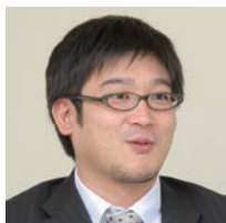
カスタマーサービス部 部長

さらに、これら2つのパッケージのDBを連携させるために導入されたのが、アステリアの「ASTERIA Warp」だ。ASTERIA Warpは多種多様なフォーマット変換、通信プロトコルに対応でき、アプリケーション間の連携が容易に行え