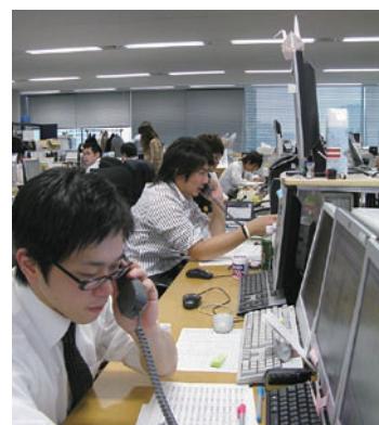
トレーダーズ証券 事業部(コンタクトセンター)

トレーダーズ証券は、FX (Foreign Exchange : 外国為替証拠金取引) と日経225先物・オプション取引を主力に扱う証券会社。2000年5月に日本初のFXオンライン取引サービスを開始したパイオニア的な存在である。オンライントレードを提供する証券会社にとって、お客様の大切な資産を管理するITシステムは、企業の中核を担う重要なインフラだ。同社は、お客さまの問い合わせや申込み情報などを、電話やメール、Webサイトから多チャネルで受け付ける新コンタクトセンターシステムを導入。散在する既存システムの連携にアステリアのASTERIA Warpを採用することで一元的なデータ管理が行えるようになり、人手を廃したメール自動配信のワンストップソリューションも実現した。