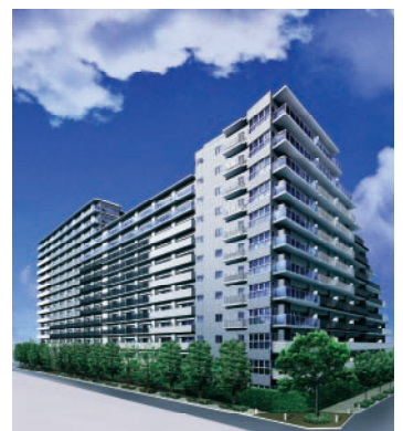
ローレルコート南浦和

近鉄不動産は、2006年夏から経理システムなどを皮切りに、基幹システムの見直しを始めた。その一環として、住商情報システムの統合型次世代ERPパッケージ「ProActive E 2 」を導入することになった。さらにアステリアのEAIツール「ASTERIA Warp」を採用し、ProActive E 2 と既存システムのスムーズなデータ連携を実現した。操作性に優れたGUIをサポートするASTERIA Warpによって、近鉄不動産は開発工程の短縮化を実現し、さらに将来にわたる拡張性や柔軟性も手に入れることができた。