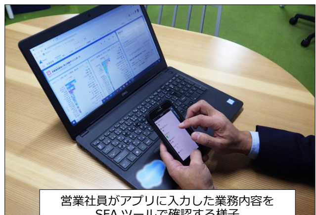
営業社員がアプリに入力した業務内容を SFA ツールで確認する様子

しかしながら、営業工数データの収集・分析を通じたさらなる業務効率化、営業社員の入力工数の削減、帰社後の報告ではリアルタイムな情報共有が難しい、という課題を抱えていました。