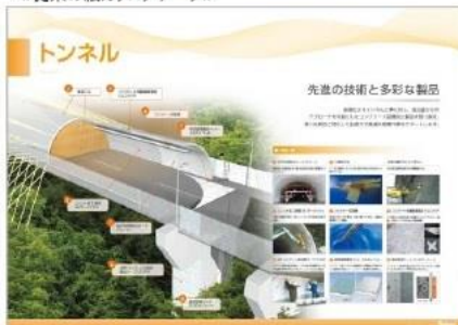
<従来の紙カタログデータ>