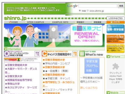
進路・進学情報サイト「shinro.jp」

Excelファイルを作成、印刷し、宛名などを一枚一枚手書きして送信していたため、内勤スタッフの大きな負担となっていた。