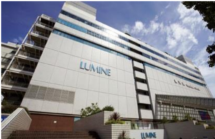
オムニチャネル化を推進するルミネ

そこで 2013 年 9 月に ASTERIA WARP を用いた「新 i LUMINE E コマース基盤」を構築することでデータ連携先追加の短期化を実現。また、実店舗の在庫と「i LUMINE」の在庫を連携することなどにより統合販売チャネルとしての機能を強化し、オムニチャネル※ 3 化を促進する基盤を整備しました。