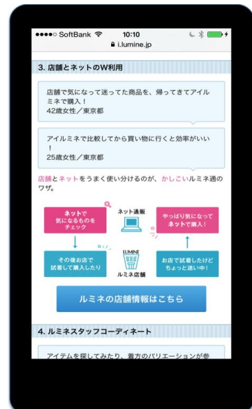
実店舗と EC サイトの 連携機能を説明する画面

オムニチャネル化の推進にあたっては、各ショップとの様々なデータをシームレス※ 4 に連携するシステム基盤が重要となります。「i LUMINE」では ASTERIA WARP を採用したことで、ノンプログラミングで簡単に店舗とのデータ連携処理を実現できるため、出店店舗の拡充や新機能の追加などをスピーディーに行うことを実現することが可能となりました。