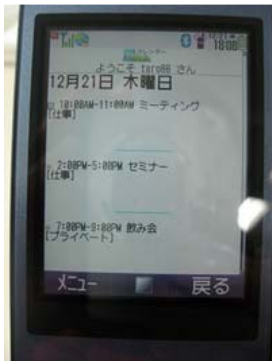
携帯で閲覧した画面