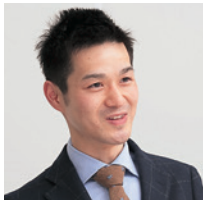
フードリンク株式会社 情報システム・ロジスティクス部 主任