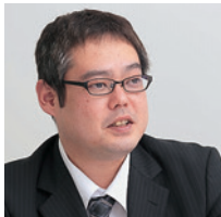
フードリンク株式会社 情報システム・ロジスティクス部 係長

また同社は、ASTERIA Warpの採用を決めたのち、入念なテストも実施した。「先行して小規模なテスト環境を構築し、利用開始にあたっての機能理解につとめました。同時に、処理速度や安定性を徹底検証。結果、使い