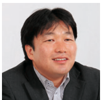
三井不動産リアルティ株式会社 リパーク事業本部 事業推進部 運営業務グループ 主任

「三井のリハウス」「三井のリパーク」でおなじみの三井不動産リアルティ株式会社。同社が展開する駐車場事業「三井のリパーク」では、全国14万台分にもものぼる時間貸駐車場と月極駐車場を運営している。この駐車場運営に関する情報を一元管理するため、同社は駐車場管理システム「Rism」を独自に開発。その上で、アステリアの「ASTERIA Warp」を活用して、Rismを他のシステムと連携させることで、月次会計処理の効率化、営業担当者間の情報共有、マネジメント層の迅速かつ的確な意思決定に役立っている。